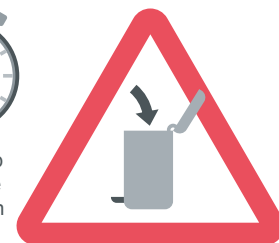
Entsorgung aller Reste